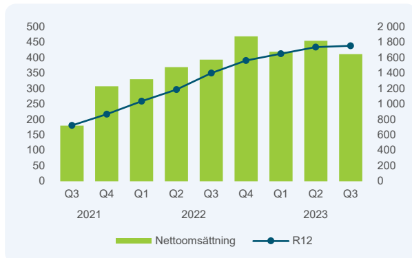
Nettoomsättning, per kvartal och rullande 12 månader, mkr