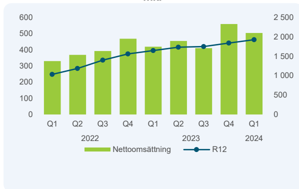
Nettoomsättning, per kvartal och rullande 12 månader, mkr